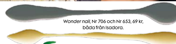
Wonder nail, Nr 706 och Nr 653, 69 kr, båda från Isadora.

Häng på säsongens discotrend med glitrande spegelbollar till manikyr! Den mer modesta väljer minsta möjliga glitterkorn, den partysugna dekorerar med mycket och iögonfallande skimmer.