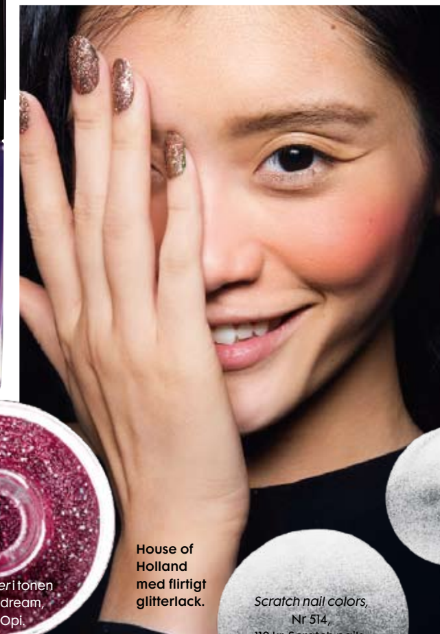
House of Holland med flirtigt glitterlack.