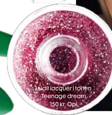
Nail lacquer i tonen Teenage dream, 150 kr, Opi.