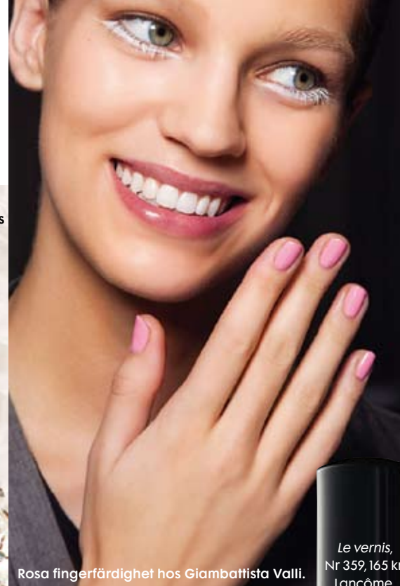
Rosa fingerfärdighet hos Giambattista Valli.