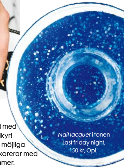
Nail lacquer i tonen Last Friday night, 150 kr, Opi.