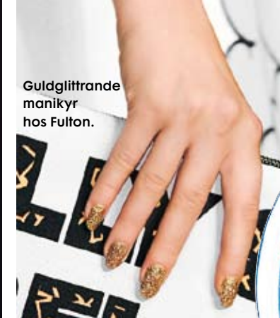
Guldglitrande manikyr hos Fulton.