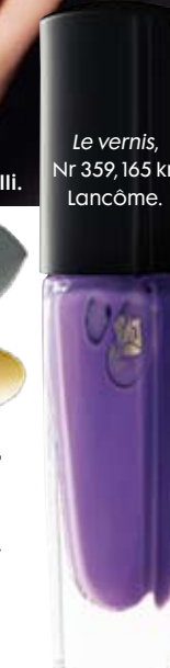
Le vernis, Nr 359, 165 kr, Lancôme.