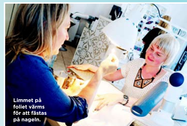
Limmet på foliet värms för att fästas på nageln.

Jag tycker att Minx är ett perfekt sätt att få sina naglar snygga på ett lätt sätt. Det var skönt att inte behöva lacka dem på ett tag och jag fick mycket komplimanger.